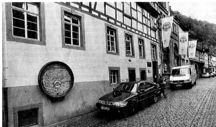
„Rund um den Kirchturm“ vertreibt die Traditionsbrauerei seit 1654 ihr Bier.

Das Brauhaus, dessen Produktionsstätte mitten in der Miltenberger Altstadt liegt, beschäftigt 29 Mitarbeiter und beliefert, wie es im Volksmund heißt, „rund um den Schornstein herum“ Getränkemärkte und Gaststätten. Etwa 40 000 Hektoliter Bier werden jährlich in der Brauerei, die 1654 erstmals erwähnt worden war und die sich seit 1895 im Besitz der Familie Faust befindet, hergestellt. Das Lager befindet sich auf der anderen Mainseite am Fährweg.