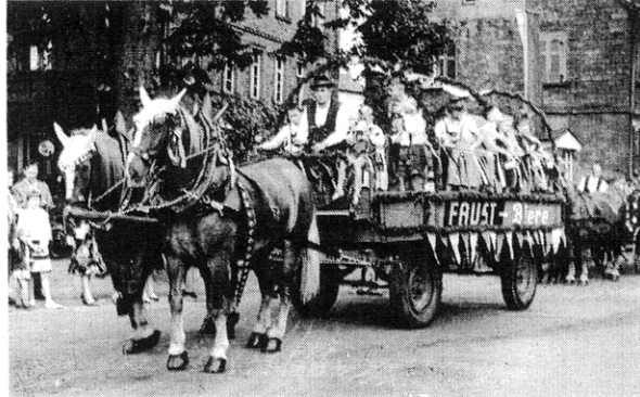
Messeinzug im Jahr 1959: Kinder auf dem geschmückten Pferdefuhrwerk der Faust-Brauerei (oben). Die feschen Bedienungsfrauen fahren auf dem Brauerei-LKW zu ihrem Einsatzort (unten).

dahin immer 3 Tage gedauert. In jedem Jahr waren besondere Attraktionen geboten. So flog General Ernst Udet, der im ersten Weltkrieg ein berühmter Jagdflieger war, unter der Mainbrücke durch. Ich erinnere mich auch an eine Fallschirmspringerin, welche dann in einem Baum in der Gartenstraße gelandet ist. Es gab die Dicke Vera und die Frau ohne Unterleib zu bestaunen. Auch Pferderennen und landwirtschaftliche Schauen wurden abgehalten. Dort gab es gefährliche Stiere, die an Nasenringen geführt wurden und die den Kindern gehörigen Repekt einflößten. Nach der Währungsreform 1949 wurde die Michelsmess wieder ins